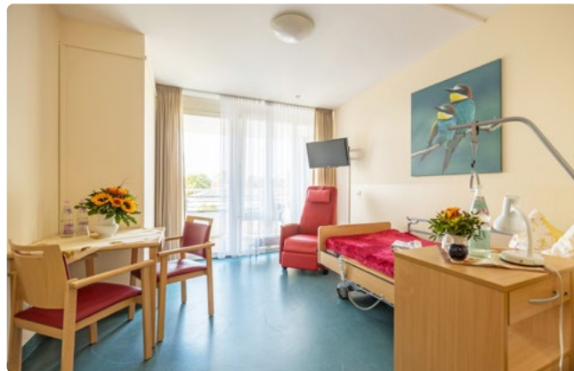
Gut aufgehoben in der Kurzzeitpflege