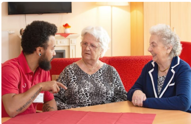
Entlastung für Angehörige und Pflegepersonen