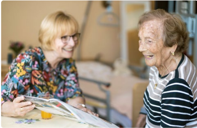
Ganzheitliche Betreuung von Seniorinnen und Senioren

Die Hufeisensiedlung, das Britzer Schloss und der Park Akazienwäldchen sind mit einem gemütlichen Spaziergang gut zu erreichen.