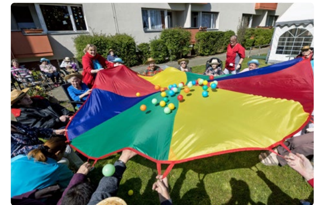
Umfangreiche Beschäftigungsangebote sorgen für Abwechslung und Teilhabe