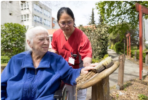
Der Sinnesgarten des Hauses