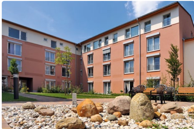
Schöner Garten im Innenhof des Hauses