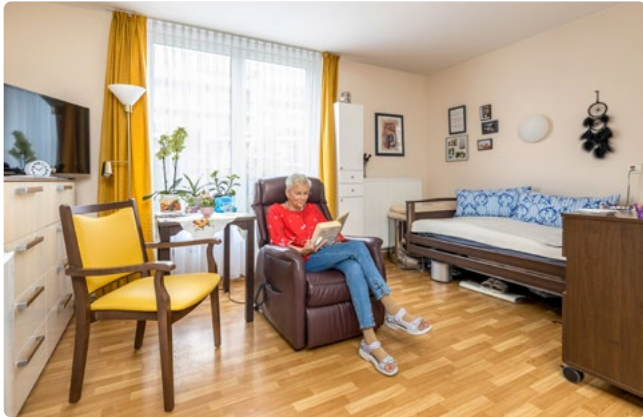
Die Zimmerausstattung kann individuell ergänzt werden

Das Hauptstadtpflege Haus John F. Kennedy wurde 2010 eröffnet und liegt in Alt-Wittenau, einem ruhigen Wohngebiet. Es besteht aus zwei miteinander verbundenen Gebäudeteilen. Neben dem allgemeinen Pflegebereich finden Sie im Haus John F. Kennedy ebenfalls einen gerontopsychiatrischen Pflegebereich. Einkaufsmöglichkeiten sind in der Nähe vorhanden.