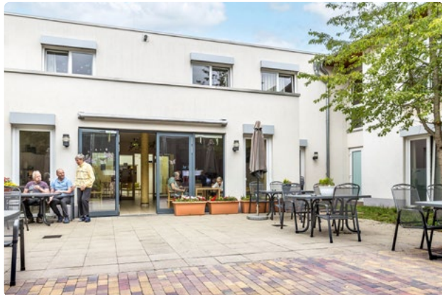
Geschützter Innenhof zum längeren oder kürzeren Verweilen