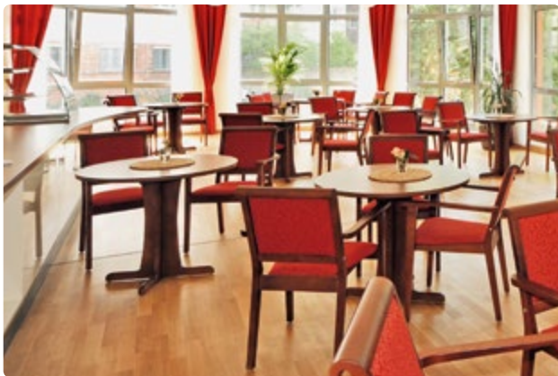
Freundlich und heller Speisesaal des Hauses