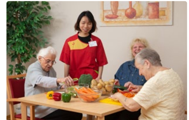
Bewohner*innen und Mitarbeitende haben Spaß am gemeinsamen Kochen