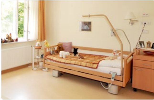
Die Zimmerausstattung kann individuell ergänzt werden

Das denkmalgeschützte Hauptstadtpflege Haus Wilmersdorf ist direkt am Hohenzollerndamm zwischen Schmargendorf und Dahlem gelegen. Der vollständig sanierte und modernisierte 3-stöckige Bau verfügt über einen großzügigen Garten mit einem idyllisch angelegten Teich und einem Hochbeet. Eine Kräuterspirale kann von den Bewohner*innen gepflegt werden und liefert frische Zutaten für die Kochgruppe des Hauses.